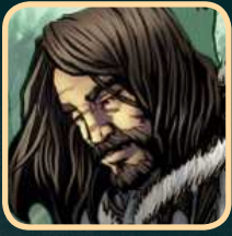
Eddard "Ned" Stark