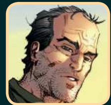
Ser Jorah Mormont