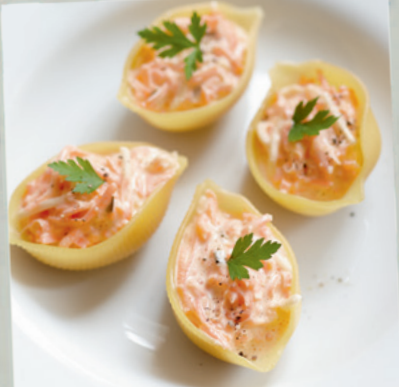
Partys & Feiern Seite 214