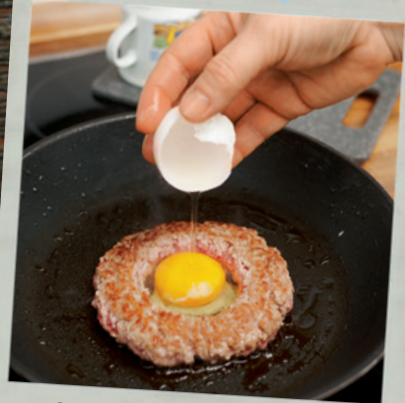
Snacks & Mahlzeiten Seite 144