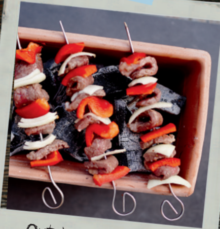
Outdoor & Barbecue Seite 176