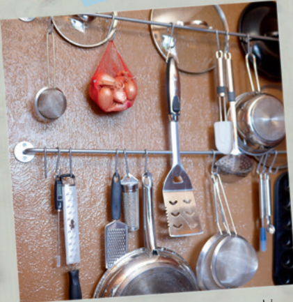
Aufbewahren & Frischhalten Seite 252