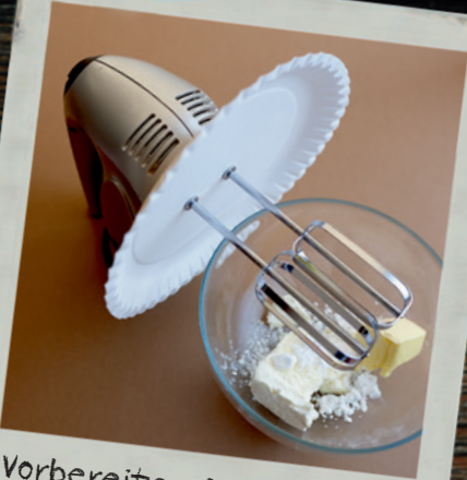
Vorbereiten & Zubereiten Seite 6