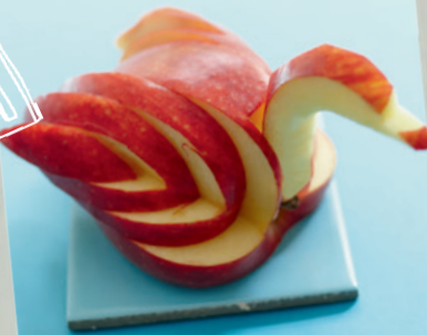
Garnieren & Servieren Seite 104