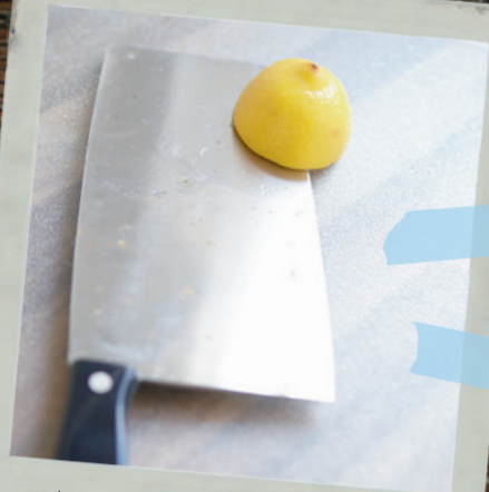
Aufräumen & Reinigen Seite 284