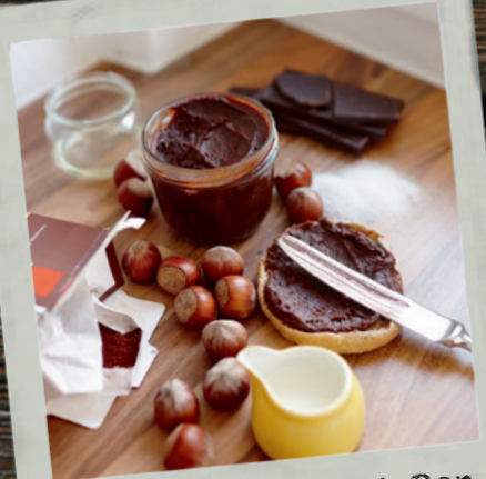
Ausprobieren & Genießen Seite 58