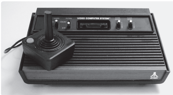
Bild 1.1 Atari VCS 2600

In der Folge versuchten unzählige Unternehmen, mit Spielen oder sogar mit eigenen Spielkonsolen am Erfolg teilzuhaben – bis der Markt 1983 aufgrund von Übersättigung, sinkender Qualität und der wachsenden Konkurrenz durch preisgünstige Heimcomputer vollständig zusammenbrach. Ab hier verläuft die