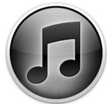
Bild 1.1 Das neue Logo