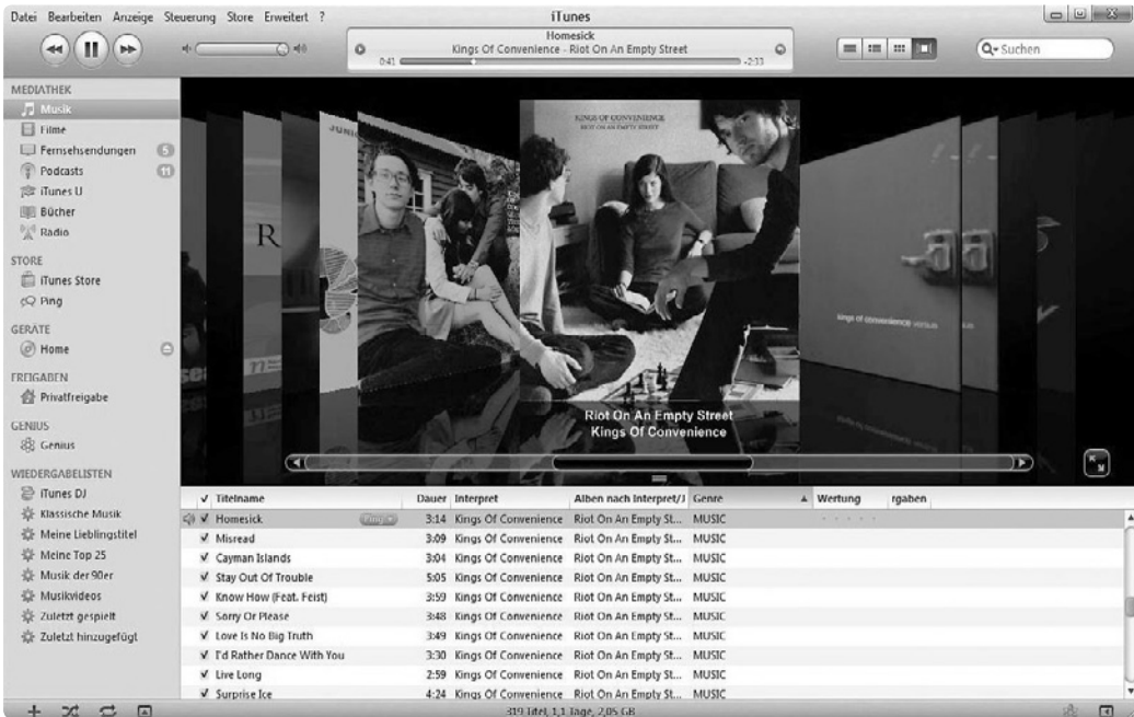
Bild 1.3 Das iTunes-Programmfenster, allerdings schon mit einigen Inhalten