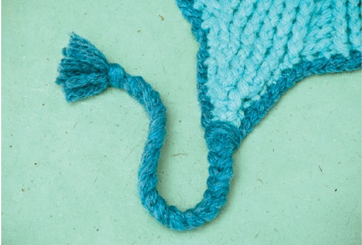
Ohrenklappe mit Zopfband.