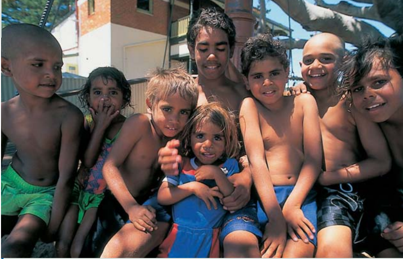
Gut gelaunt: Aborigine-Kinder auf der Strandpromenade von Geraldton

kelste Kapitel der kurzen weißen Geschichte Australiens beraubte die seit Urzeiten heimischen Bewohner des Landes ihrer Wurzeln, machte sie heimatlos und zum Freiwild. So schrumpfte ihre Bevölkerungszahl von 300 000 (1770) auf 60 000 (1920). Am ehesten konnten die Aborigines ihr angestammtes Dasein im wüstenähnlichen Zentrum und im unwegsamen »Top End« im Norden weiterführen, überall dort, wo sich die lebensfeindliche Natur dem europäischen Expansionsdrang widersetzte. Auf den großen Rinderstationen fanden sie Arbeit, die ihrer traditionellen Lebensweise am ehesten entsprach. Am schlimmsten war und ist das Schicksal der entwurzelten Aborigines und Mischlinge in den Slums der Städte, wo sie mit der Sozialhilfe zwar ein Existenzminimum erhalten, aber kaum Möglichkeiten zur Integration finden und somit oft zu Opfern von Alkohol und Krankheiten werden. Nach offiziellen Erhebungen lebten Anfang des 21. Jh.s wieder rund 460 000 Aborigines in Australien.