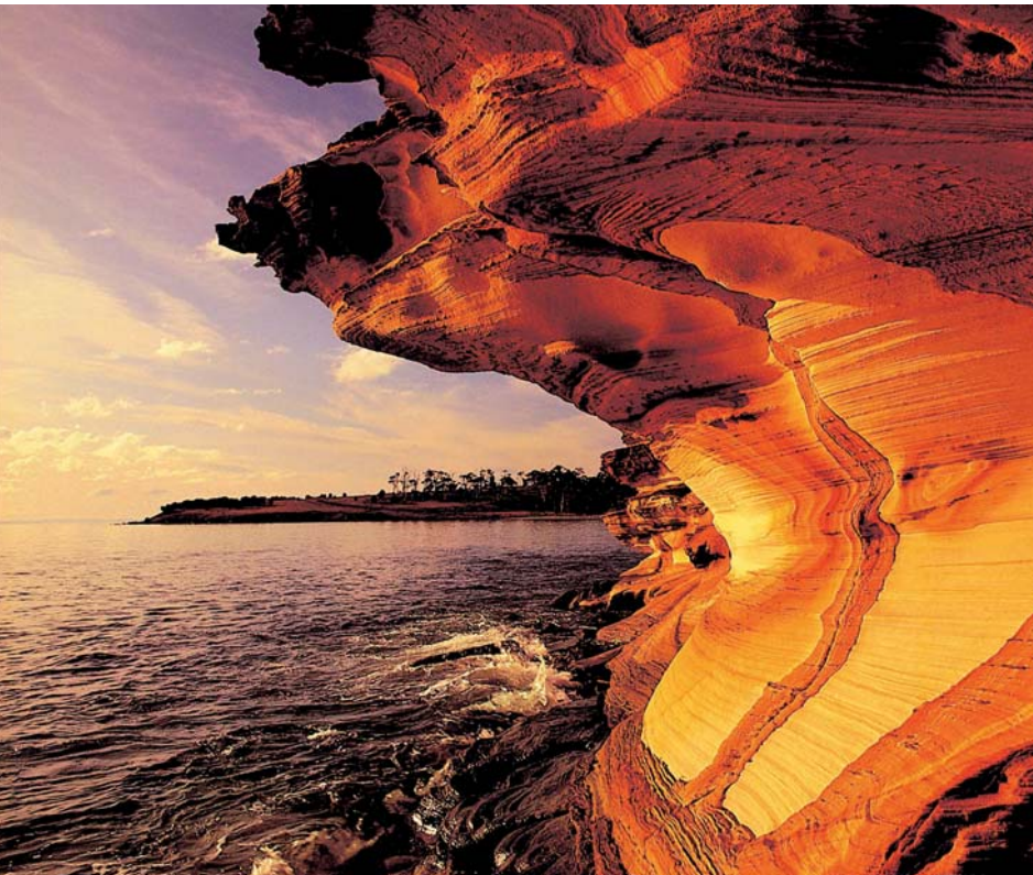
Gigantisch: die »Painted Rocks« im tasmanischen Maria Island National Park

Vogelwelt Schier unermesslich ist Australiens Vogelreichtum. Unter den 720 Arten finden sich die karmesinroten Penantsittiche, Gelbhauben- und Nacktaugenkakadus, Weißwangenreiher, Weißbauch-Seedler