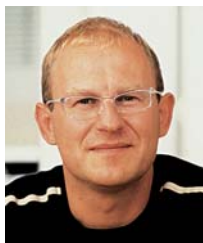
Der Fotograf Markus Kirchgessner aus Frankfurt hat trotz des unberechenbaren Wetters die Elsässer Vielfalt aus Großstädtischem, Weinorten und Vogesenwäldern genossen.

Eine beschauliche Autofahrt auf der Route des Vins d'Alsace, der Elsässer Weinstraße, vorbei an nicht endenwollenden Rebhängen. Zwischenstation in pittoresken Fachwerkorten, einer schöner als der andere, dann eine Weinprobe und ein köstliches Essen in einem der gemütlichen Restaurants, schließlich ein Bummel durch Straßburg – so stellt man sich eine klassische Elsasstour vor.