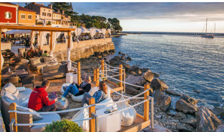
Chillen und lümmeln auf Küstenfelsen ist Trend in Istrien, z. B. in Novigrads Kultbar Pepebianco.

Novigrad, die »neue Stadt«, hat alte Wurzeln; die erste Erwähnung von »Neapolis« stammt aus dem 7. Jh. Die Altstadt um die auf romanischen Fundamenten ruhende Kirche des hl. Pelagius (crkva Sv. Pelagija) ist nicht spektakulär, aber liebenswert. Und einiges blüht im Verborgenen, so die romanische Krypta von Sv. Pelagij, die aus dem 8. Jh. stammen soll (Mo–Sa 9.30–13.30, 17.30–22 Uhr, 15 Kn). Im Gotteshaus gefundene Kostbarkeiten wie das Mauritius-Ziborium (8. Jh.) zeigt der moderne Glaskubus des Lapidariums, Lapidarij , neben weiteren Fragmenten frühchristlicher und mittelalterlicher Steindenkmäler. Es ist ein schlichter und sehr schöner Museumsbau, der gar nicht erst versucht, mit den Exponaten zu konkurrieren (Veliki trg 8 a, T 052 72 65 82, www.muzej-lapidarium.hr, Juni–Sept. Di–So 10–13, 18–22 Uhr, sonst eingeschränkte Öffnungszeiten, 10 Kn). Auch mit einer für Istrien einzigartigen, weil direkt am Meer stehenden Loggia (16. Jh.) kann Novigrad punkten. Zu