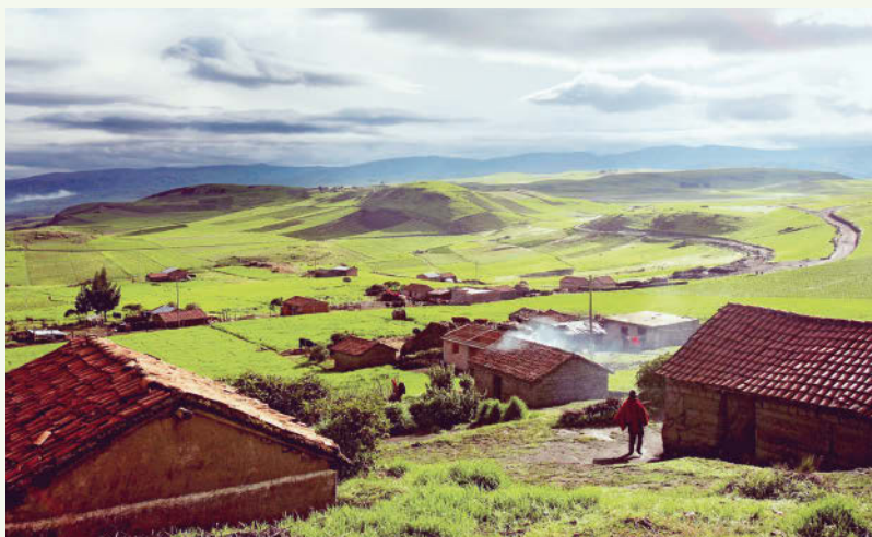
Kleine Landgemeinde oberhalb von Alausí

den frühen Zug zu kommen. Die beste Zeit für Wanderungen in den regenreichen Hochland-Nationalparks von El Cajas und Podocarpus sind die Monate Oktober bis Dezember.