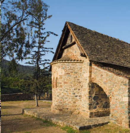
Waldtal von Asínou – Kunst, Natur und kulinarische Genüsse, S. 195

Die Reiseführer von DuMont werden von Autoren geschrieben, die ihr Buch ständig aktualisieren und daher immer wieder dieselben Orte besuchen. Irgendwann entdeckt dabei jeder Autor seine ganz persönlichen Lieblingsorte. Dörfer, die abseits des touristischen Mainstreams liegen, eine ganz besondere Strandbucht, Plätze, die zum Entspannen einladen, ein Stückchen ursprünglicher Natur, eben Wohlfühlorte, an die man immer wiederkehren möchte.