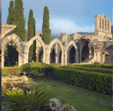
Bellapáís Garden Restaurant – Slowfood in Klostersnähe, S. 247