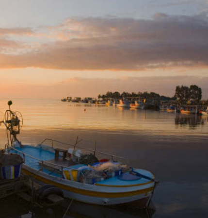
Potamós tou Liopetriou – einzigartige Flussmündung, S. 105