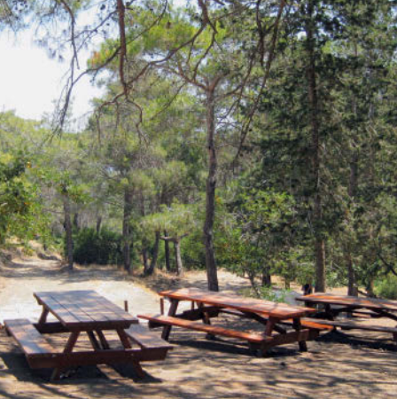
Picknickplatz Smigiés – hier starten zwei reizvolle Naturlehrpfade, S. 182