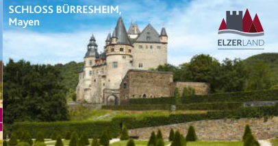
SCHLOSS BÜRRESHEIM, Mayen