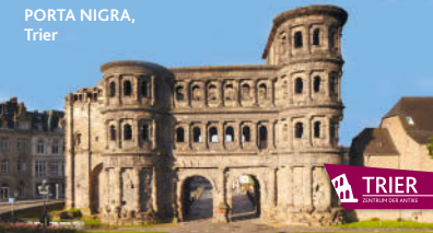
PORTA NIGRA, Trier

Rheinland-Pfalz GENERALDIREKTION KULTURELLES ERBE