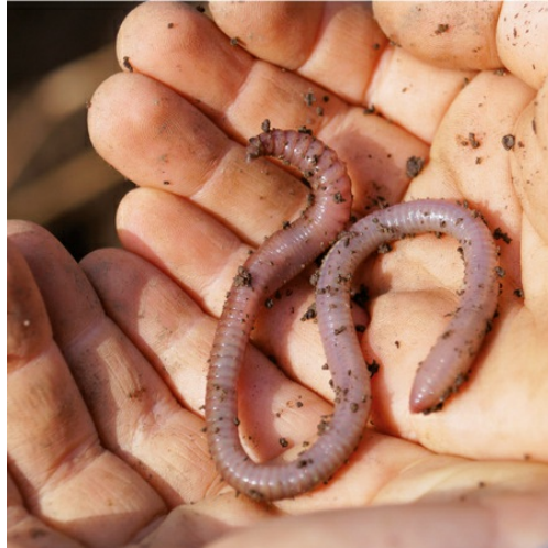
Wenn man vom Regenwurm spricht, ist meistens der Tauwurm ( Lumbricus terrestris ) gemeint.

Durch tiefes Pflügen wird ihr Bestand allerdings stark reduziert, ebenso durch Pestizide. 2015 konnte nachgewiesen werden, dass ihre Aktivität und ihre Fortpflanzungsrate durch das Unkrautvernichtungsmittel Glyphosat erheblich nachlässt. In ausgelaugten oder belasteten Böden findet man sie deshalb nur noch vereinzelt oder gar nicht mehr.