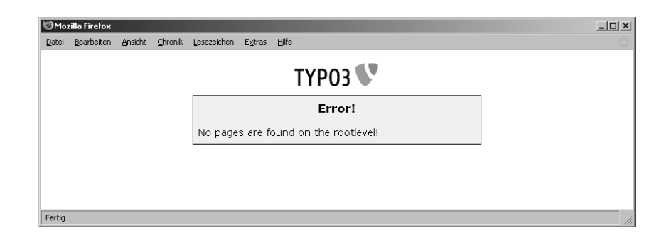
Abbildung 3-1: Es wurden noch keine Seiten angelegt