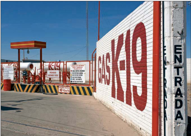
015pa Abb.: sk