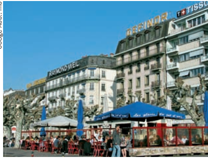
▲ Einladende Freiluftcafés an der Seepromenade