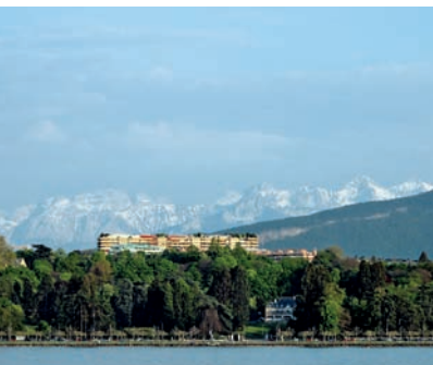
011ige Abb.: mb