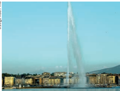
▲ Wahrzeichen Genfs: der Jet d'eau