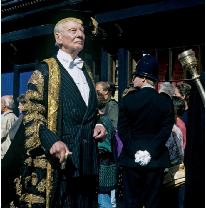
0600x Abb.: g5