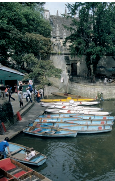
0620x Abb.: gs

Der Tag beginnt mit einem Besuch von Christ Church 25, dem repräsentativsten College Oxfords samt Kathedrale und einer Galerie europäischer Meister. Etwa zwei Stunden sollte man für diesen Besuch einplanen. Über die kopfsteingepflasterte Meriton Street geht es anschließend zur