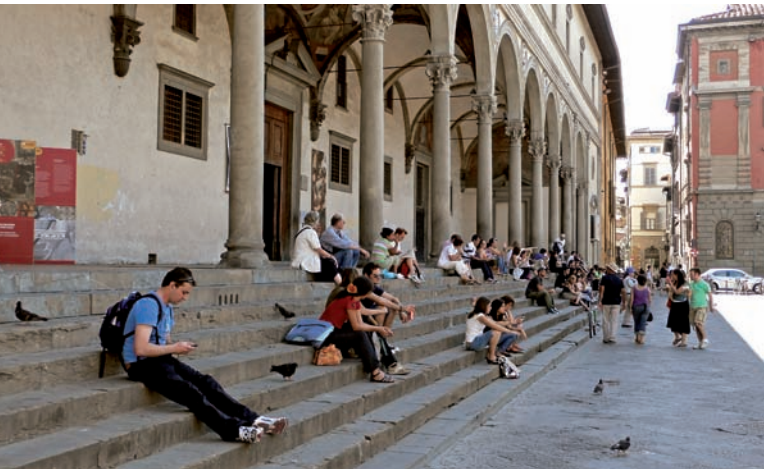
009fi Abb.: sk

Michelangelo. Doch er ist nicht allein, zahlreiche Figuren und Figurengruppen schmücken den Platz und seine Loggia.