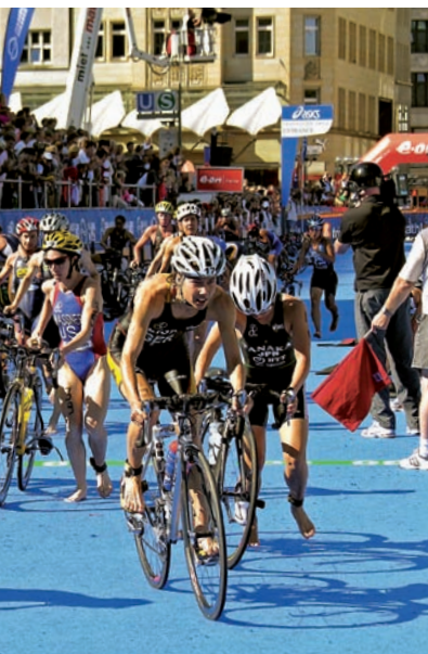
011ha Abb.: sm