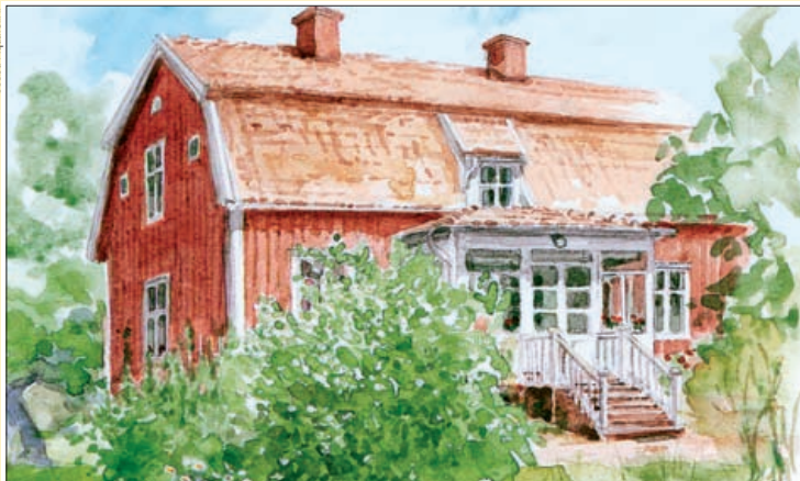
Das rote Haus, Aquarell von Leif Ruhnström