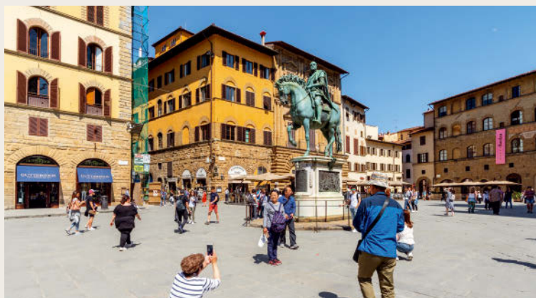
Reiterstandbild Cosimos I. auf der Piazza della Signoria

Allerdings zog er das Vergnügen den Staatsgeschäften vor – wie auch die sechs Generationen seiner Nachfolger als Herrscher von Florenz. Dem Ruf der Familie tat dies nur wenig Abbruch – es waren die mächtigen, unbezwingbaren Medici. Als 1743 mit Anna Maria Luisa die Letzte des Geschlechts das Zeitliche segnete, trauerte die ganze Stadt um sie.