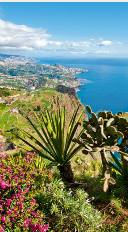
Blick vom etwa 580 Meter hohen Cabo Girão auf Funchal

Senkrecht steigen zerklüftete Felswände aus dem Meer: Wo es auf Madeira nicht grünt und blüht, prägen braunschwarze Lavafelsen, dunkle Basalte und helle vulkanische Tuffe die Inselwelt.