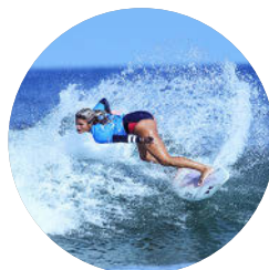
Surfen, Jacksonville (S. 317)