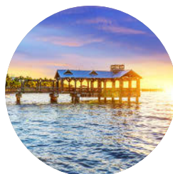
Key West (S. 156)