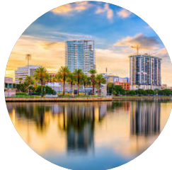
St. Petersburg (S. 348)