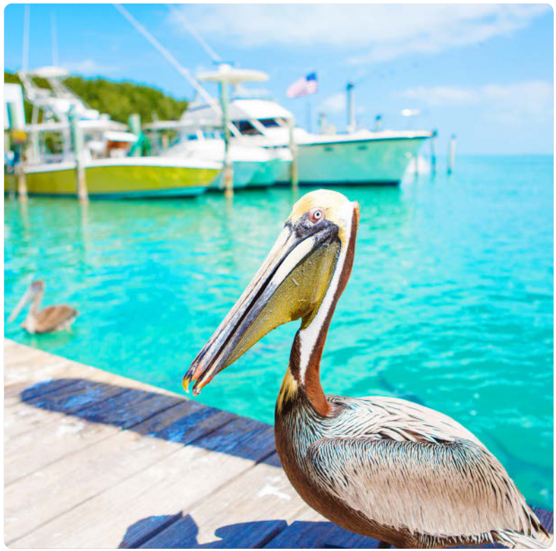
Robbie's Marina, Islamorada (S. 144)