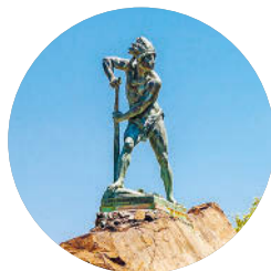
Cerro Santa Lucía (S. 52)