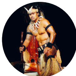
Traditioneller Tänzer (S. 334), Rapa Nui