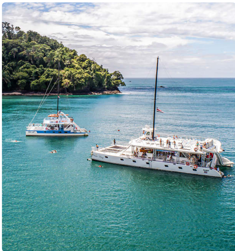
Parque Nacional Manuel Antonio (S. 347)