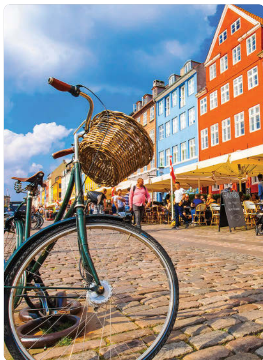
Nyhavn (S. 60)