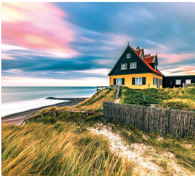
Skagen (S. 217)