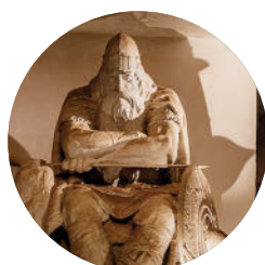
Holger-Danske-Statue (S. 100), Kronborg Slot