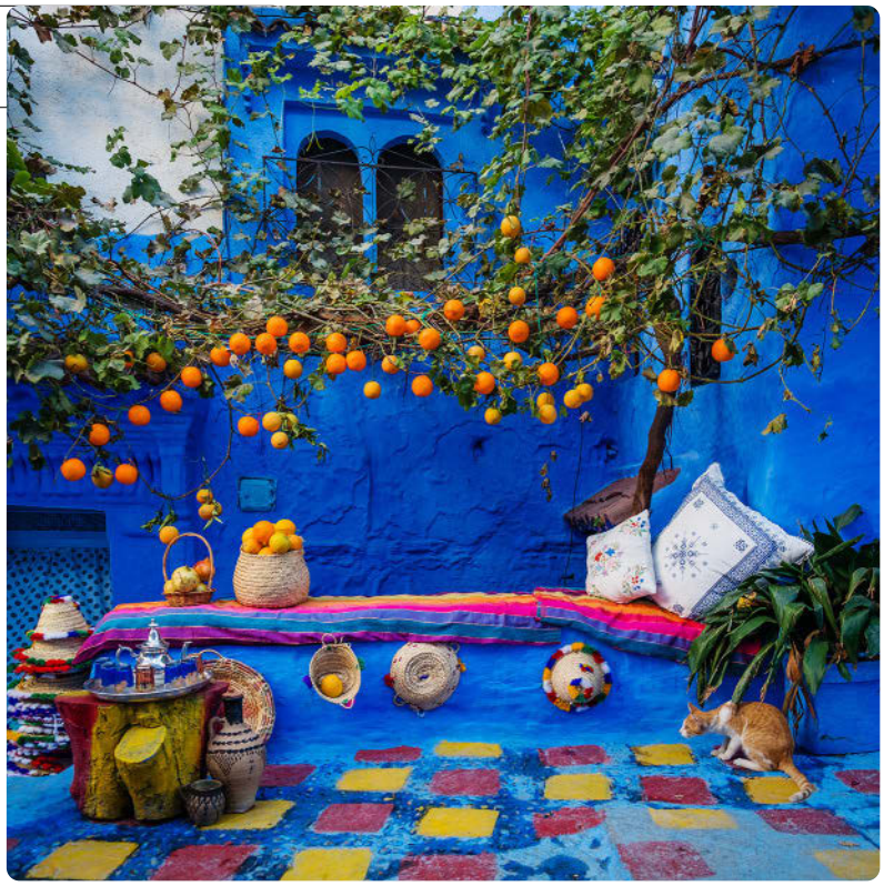
Chefchaouen (S. 236)

RECHTS: ALESSIO CAPELLI/SHUTTERSTOCK ©. UNTEN RECHTS: CURIOSO PHOTOGRAPHY/SHUTTERSTOCK ©