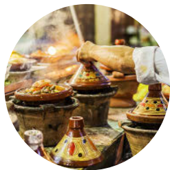
Tajine, Marrakesch (S. 46)

Im September 2023 wurde Marokko südlich von Marrakesch von einem Erdbeben erschüttert. Das Beben tötete Tausende von Menschen und verursachte Verwüstungen von der Stadt Marrakesch im Süden bis hin zu Dörfern im Atlasgebirge.