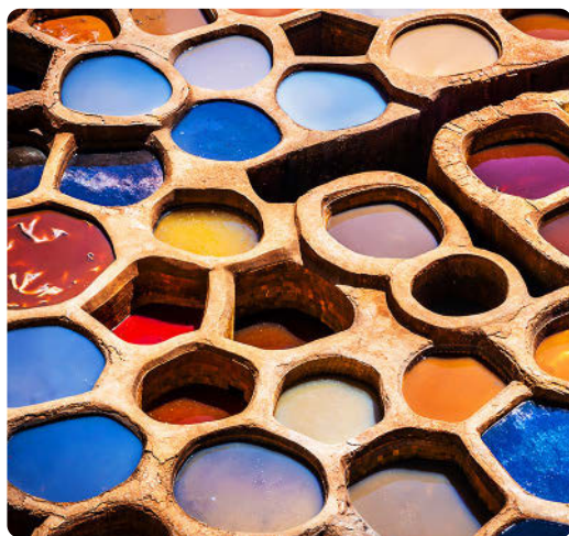
Chouara-Gerberei (S. 276), Fès