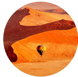
Heißluftballon, Sossusvlei (S. 275), Namibia