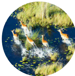
Okavango-Delta (S. 86), Botswana