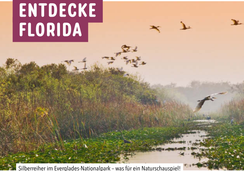
Silberreiher im Everglades-Nationalpark – was für ein Naturschauspiel!

Der American Way of Life ist ein Mythenmix aus Freiheit und Freizeit, Sonne und Sand, Optimismus und Offenheit, schnellem Geld und schnellem Genuss. Nirgendwo in den USA erlebst du diese unbekümmerte Lebensart so ausgeprägt wie in Florida. Der Sunshine State begnügt sich aber nicht mit der Erfüllung von Klischees. Vielmehr strebt er seiner eigenen multi-kulturellen Zukunft dynamisch entgegen.