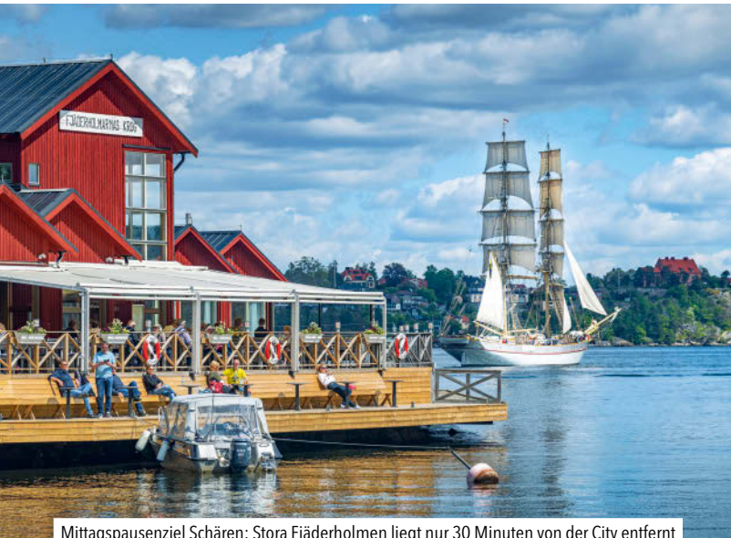
Mittagspausenziel Schären: Stora Fjäderholmen liegt nur 30 Minuten von der City entfernt

viel Geld oder gute Beziehungen. Oder viel Glück. Aber dafür bekommt man schließlich einiges geboten, von dem andere schwedische Städte nur träumen können: ein vielfältiges Kultur- und Sportangebot, jede Menge Cafés, Clubs und Restaurants, eine breite Auswahl an schicken und originellen Läden – und obendrauf die phantastischen Schären vor der Tür. Stockholm ist eben das politische und kulturelle Zentrum Schwedens, hier wird alles für den Rest des Landes entschieden, hier fließt das große Geld , hier gibt es die meisten Arbeitsplätze und die höchsten Löhne – kein Wunder, dass man im übrigen Schweden ein bisschen neidisch ist auf die Nollåttor („Nullachter“, von 08, der Telefonvorwahl für Stockholm). Ihr Image ist bei den Landsleuten angekratzt; sie gelten als arrogant, hochnäsig und vernobt.