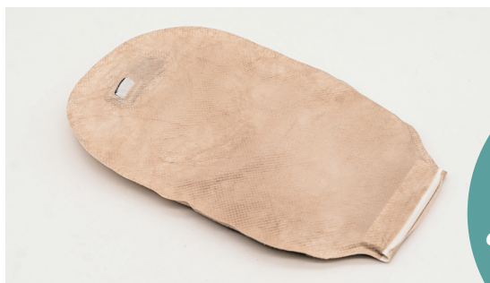
der Ileostomabeutel, -

Um den Ileostomabeutel zu wechseln, brauchen wir unter anderem einen Abwurfbehälter.