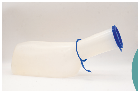
die Harnflasche, -n

Ich komme, um die Harnflasche zu entleeren.