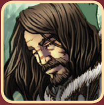
Eddard "Ned" Stark