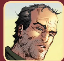
Ser Jorah Mormont