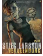
Band 2 | Verblendung – Buch 2