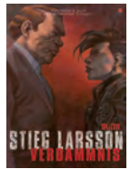
Band 3 | Verdammnis – Buch 1