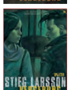
Und der Abschlussband: Band 6 | Vergebung – Buch 2

(Anmerkung: Schweden ist ein Land der ganz bewussten Entformalisierung und Gleichstellung. Dies wird unter anderem durch den systematischen Einsatz des Duzens widerspiegelt.)