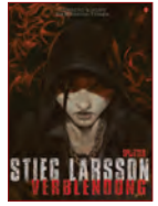
Band 1 | Verblendung – Buch 1