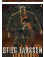
Band 5 | Vergebung – Buch 1