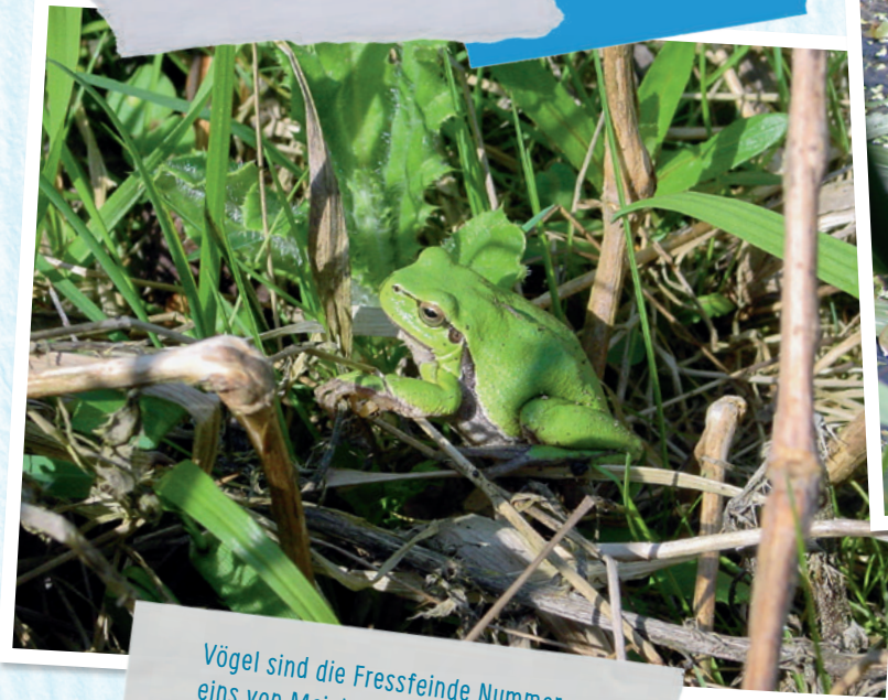
Vögel sind die Fressfeinde Nummer eins von Meister Quak.