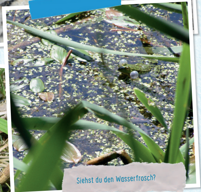
Siehst du den Wasserfrosch?

Kennst du das, wenn es draußen kälter wird, dass du dich dann weniger bewegen willst? Frösche sind da ähnlich, sie passen ihre Körpertemperatur der äußeren an und hüpfen im Herbst weniger.