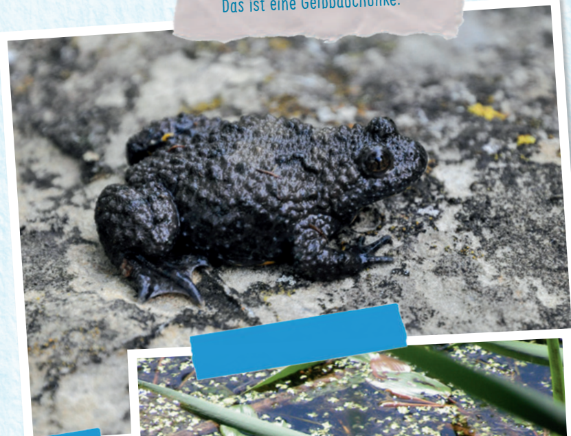
Das ist eine Gelbbauchunke.