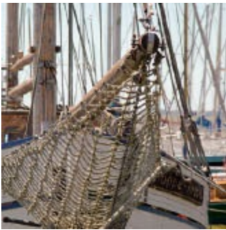
Gartenimbiss Naschkatze 17440 Krummin