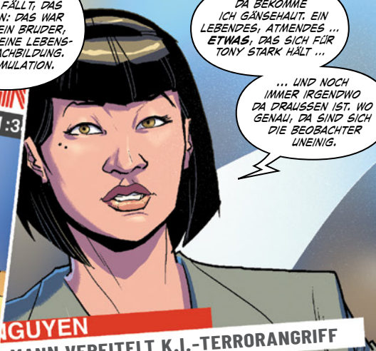
NGUYEN MANN VEREITELT K.I.-TERRORANGRIFF