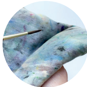
Baumwolltuch oder Küchenpapier