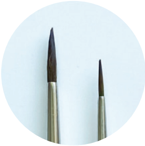
Aquarellpinsel, rund, Gr. 1 und 4