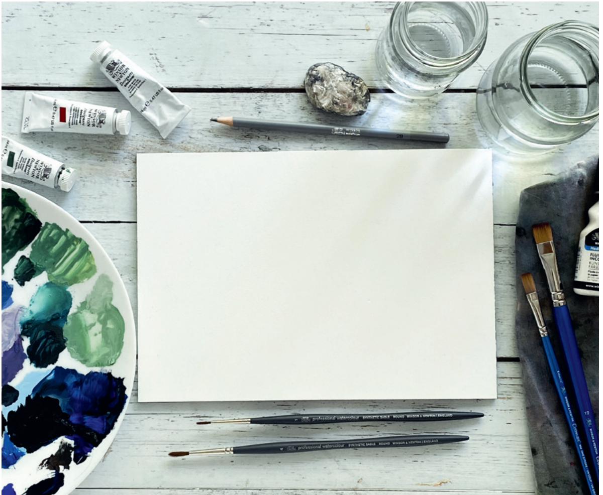
Arbeitsplatz für die Gouachemalerei

Dein Arbeitsplatz sollte sich in einer Umgebung befinden, in der du dich wohlfühlst. Als Rechtshänder ordnest du die Materialien rechts vom Malgrund an. Bei Linkshändern ist es entsprechend umgekehrt. Es ist wichtig, einen Lappen zum Abtupfen bereit liegen zu haben und große Wassergläser zu benutzen.