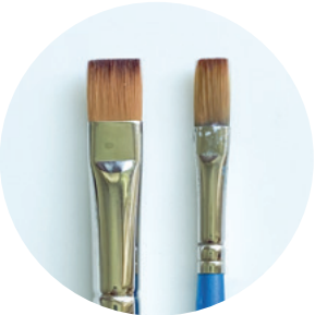
Aquarellpinsel flach, Gr. 6 mm und 13 mm