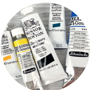
Gouachefarbe aus Tuben oder Näpfchen