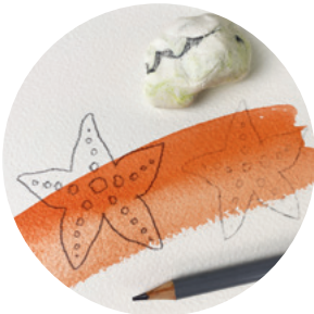
Bleistifte mit geringem Härtegrad, z.B. B oder 2B und Knetradiergummi