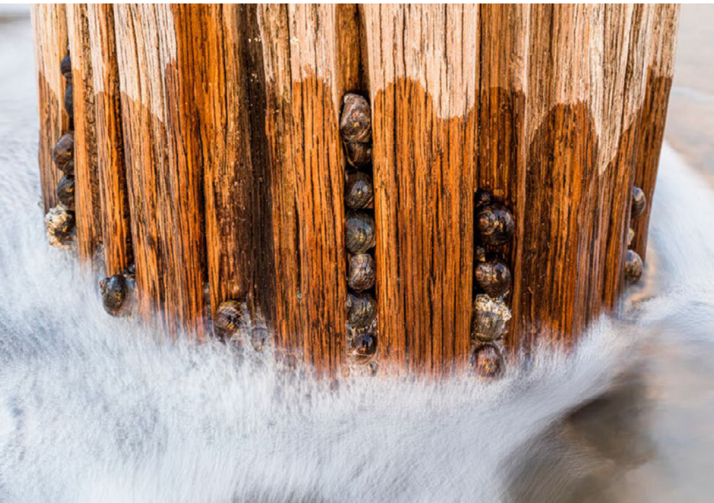
Die wohlbekannten Pfähle am Strand sind ein Lieblingsplatz der Meeresschnecken. | 100 mm, 1/6 s, Blende 16, ISO 250 und 100 mm, 0,4 s, Blende 16, ISO 400

Da sich heute mit nahezu jedem Telefon Fotos machen lassen und man so immer und überall eine Kamera dabei hat, fotografieren sehr viele Menschen Tag für Tag. Eine aktuelle Schätzung geht von etwa 2,7 Milliarden Fotos täglich aus! Und diese Bilder werden dann massenhaft auf sozialen Medien wie Instagram und Facebook geteilt. All das hat Fotografie der breiten Masse zugänglich gemacht. Sie wurde dadurch demokratisiert, und wir werden täglich überschwemmt von Bildern. Bilder sind wichtiger denn je.