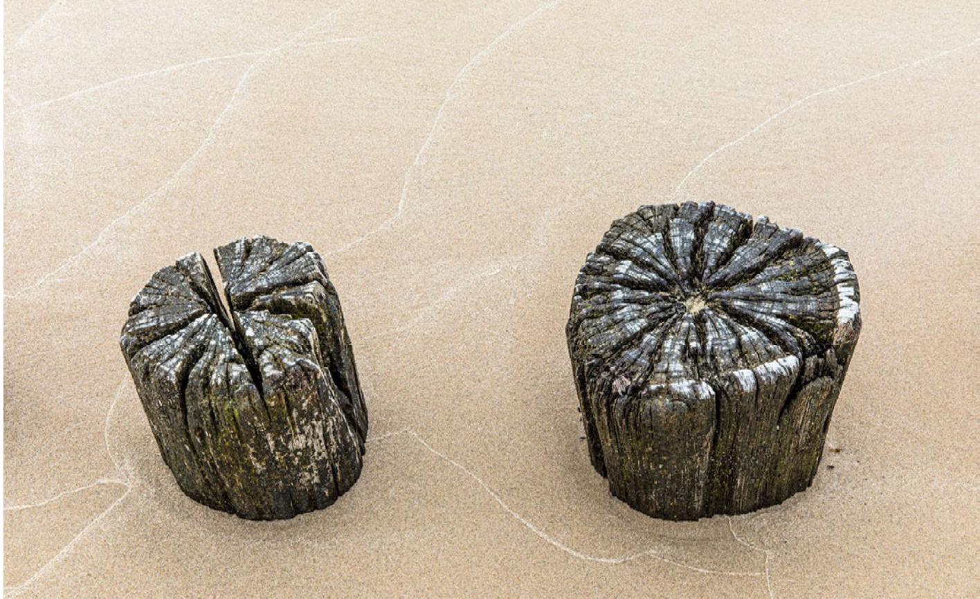
Zweimal Pfähle auf eine etwas andere als die übliche Weise fotografiert. | 50 mm, 1/25 s, Blende 16, ISO 200 und 67 mm, 1/2 s, Blende 18, ISO 100

Technik allein machen keinen Unterschied mehr. Schließlich sind all die Bilder in den sozialen Medien und in Zeitschriften von außerordentlicher Qualität, eins schöner als das andere, manchmal mittels intensiver Bildbearbeitung. Das bedeutet, dass nun andere Dinge für einen Fotografen viel wichtiger werden. Es geht dabei um so etwas wie Originalität, den persönlichen Stil, eine eigene Vision und die Fähigkeit, Menschen zu berühren und mit den eigenen Bildern eine Geschichte zu erzählen. Zu diesen Themen finden sich viel weniger Lehrbücher und Workshops, und es ist deutlich schwieriger, sie sich anzueignen. Dafür gibt es keine fertigen Rezepte oder Tricks – was nicht heißen soll, dass Sie nicht daran arbeiten und entsprechende Fähigkeiten entwickeln können. Deshalb werde ich in diesem Buch wiederholt auf diese Dinge eingehen. Denken Sie dabei immer an das englische Sprichwort: »Give a man a fish and you feed him for a day; teach a man to fish and you feed him for a lifetime.« 1 Der Schwerpunkt dieses Buchs liegt darauf, dass Sie selbst fischen lernen!