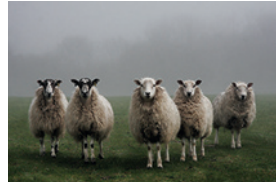
f) _____ _____