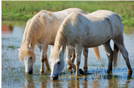
d) _____ _____