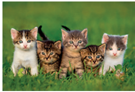
b) _____ _____