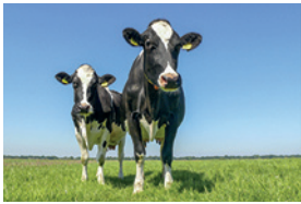
a) TWO COWS

Schreibe unter jedes Bild, wie viele Tiere abgebildet sind.