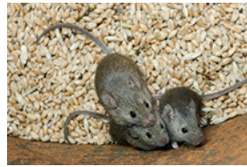
c) _____ _____