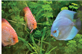
e) _____ _____