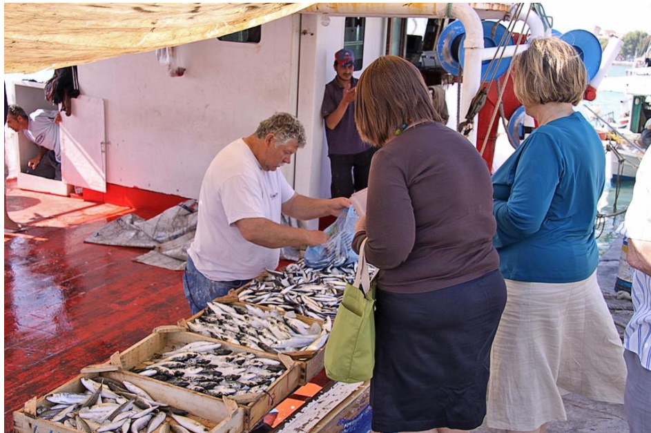
Am Morgen kann man frischen Fisch direkt vom Boot kaufen

Kulturelle Veranstaltungen Im Freilichttheater an der Straße zur Oberstadt werden im Sommer regelmäßig Schauspiele in griechischer Sprache aufgeführt. Aber auch für Musikfreunde wird vom Konzert bis zu Tanzabenden einiges geboten. Programme erhalten Sie z. B. am späten Nachmittag an einem Stand vor der Bibliothek. Dort können Sie im Vorverkauf Karten erwerben. Die Vorstellungen beginnen i. d. R. nicht vor 21.30 Uhr.