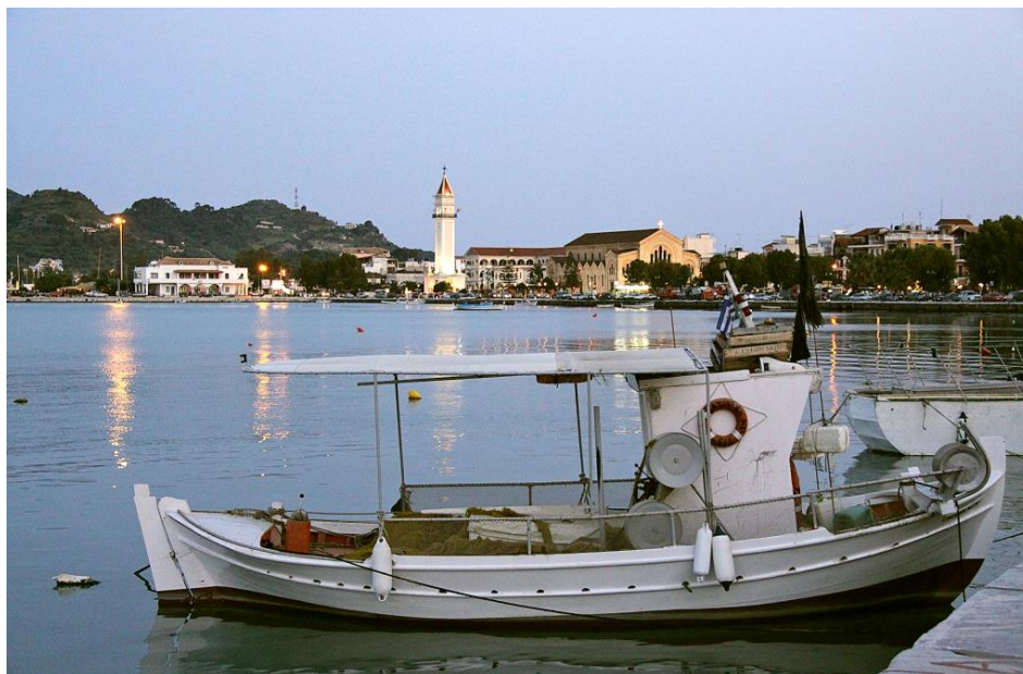
Abendstimmung am Wasser

Verbindungen Bus: Der Busbahnhof befindet sich in der Odós Iatroú G. Mothonéos oberhalb des Zentrums der Stadt, Tel. 2695022255 und 2695042656 . Dort erhält man auch einen aktuellen Fahrplan, diesen findet man außerdem unter www.ktel-zakynthos.gr .