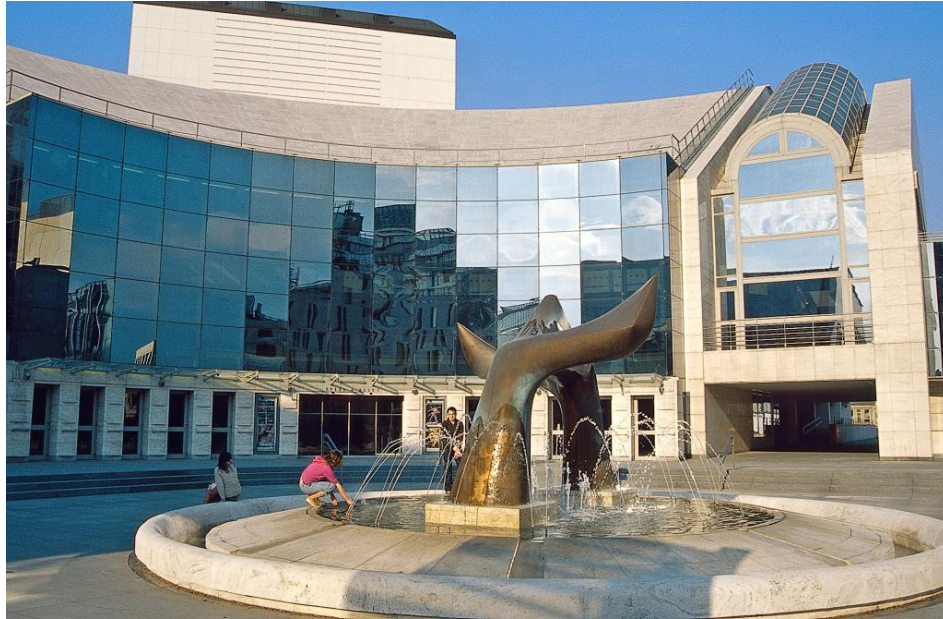
Neues Gebäude des Slowakischen Nationaltheaters

Sauna Neptún , in der Schwimmhalle Pasienky , Sauna 10,40 €. Junácka 4, Tel. 02/49209684, www.starz.sk .