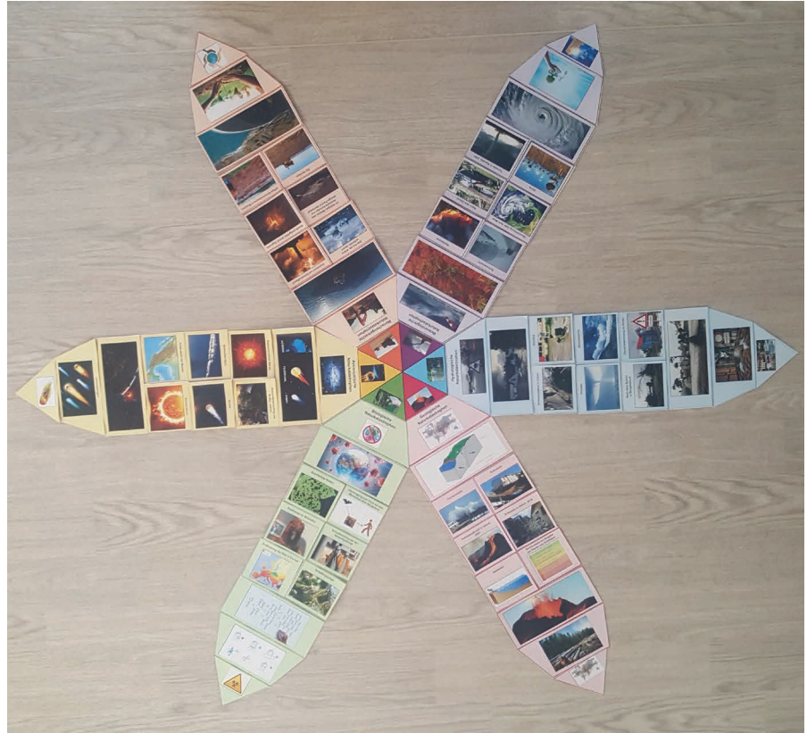
Aufbau Legestern Rückseite