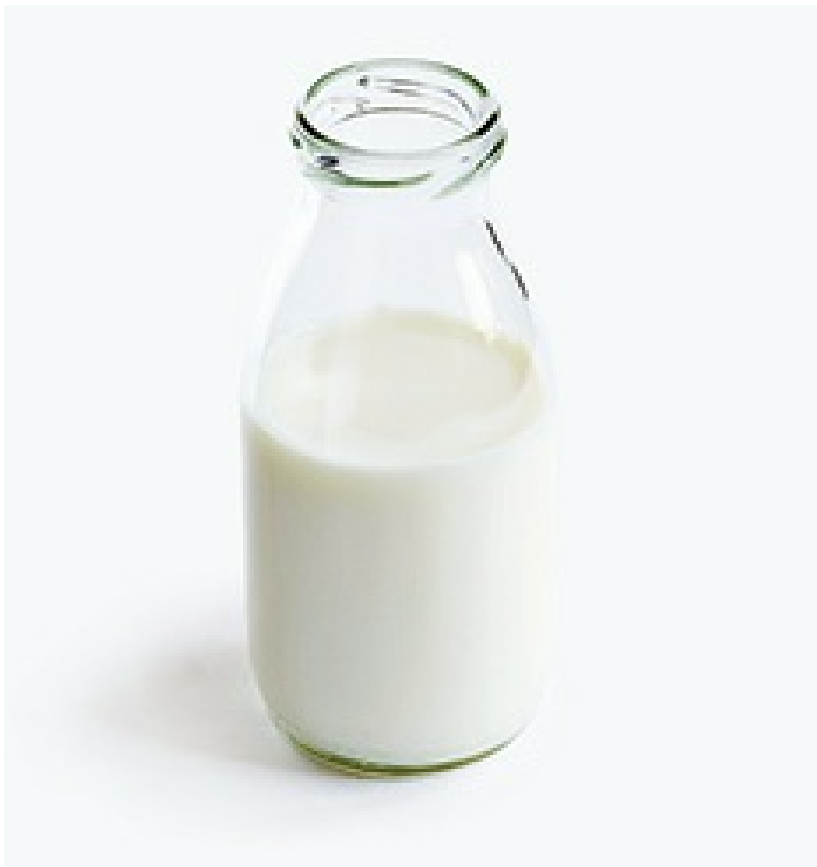
50 ml Milch

1. Heitzt den Ofen auf 180 °C vor. Fettet das Backblech oder das Muffinblech ein.