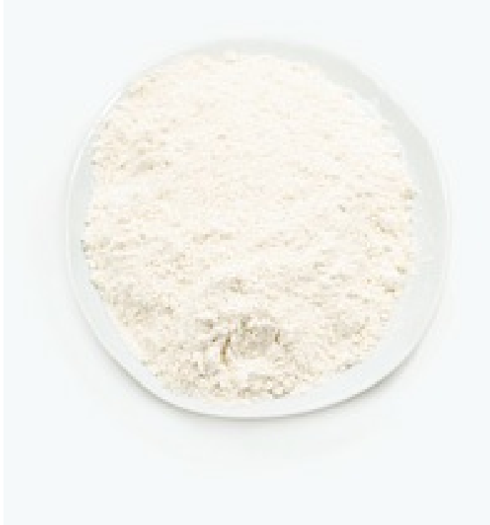
200 g Mehl