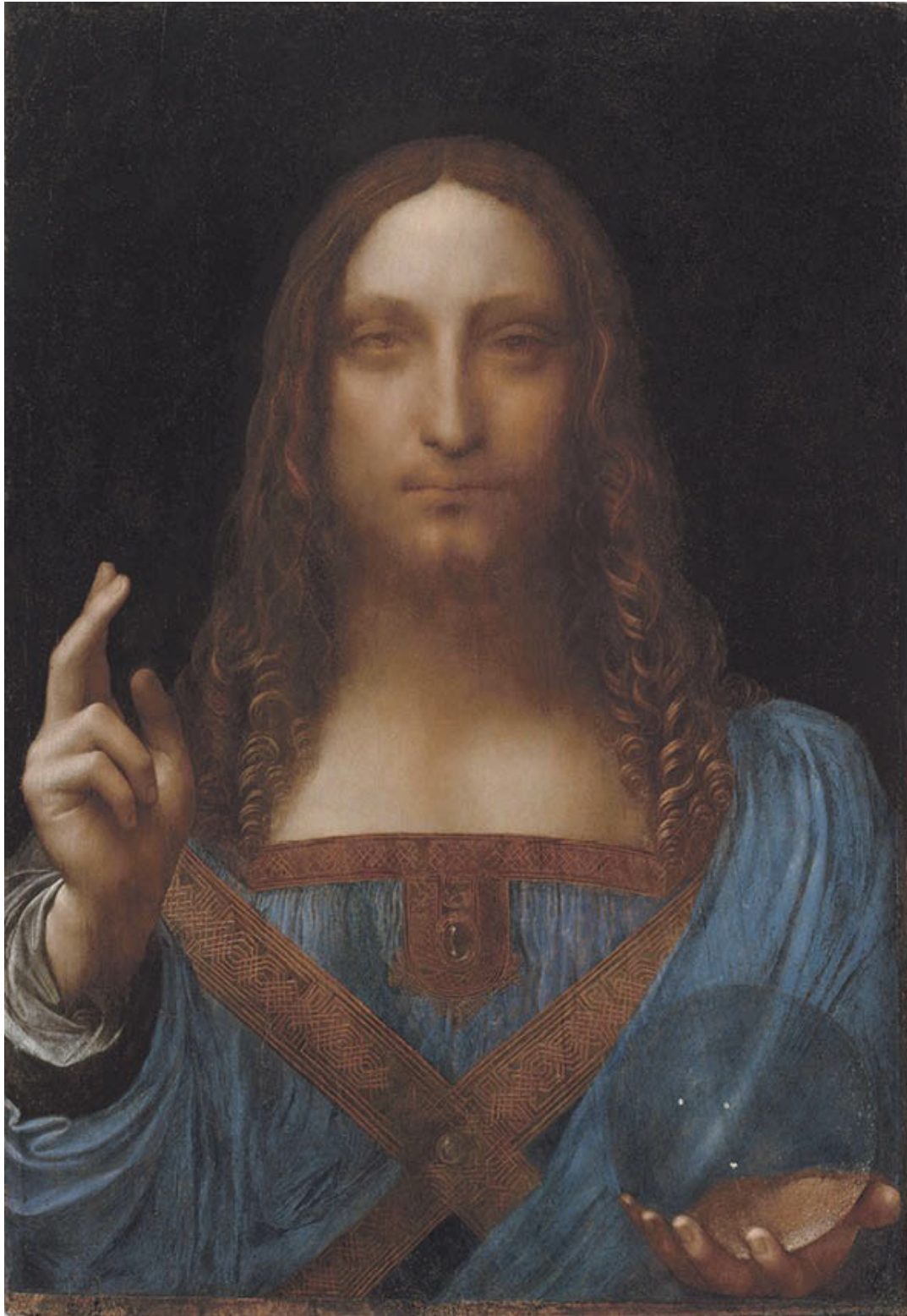
Leonardo da Vinci und Werkstatt (?), Christus als Salvator mundi, 1499/1505 (?), Öl auf Walnußholz, 65,5 × 45,1 cm, Louvre Abu Dhabi.