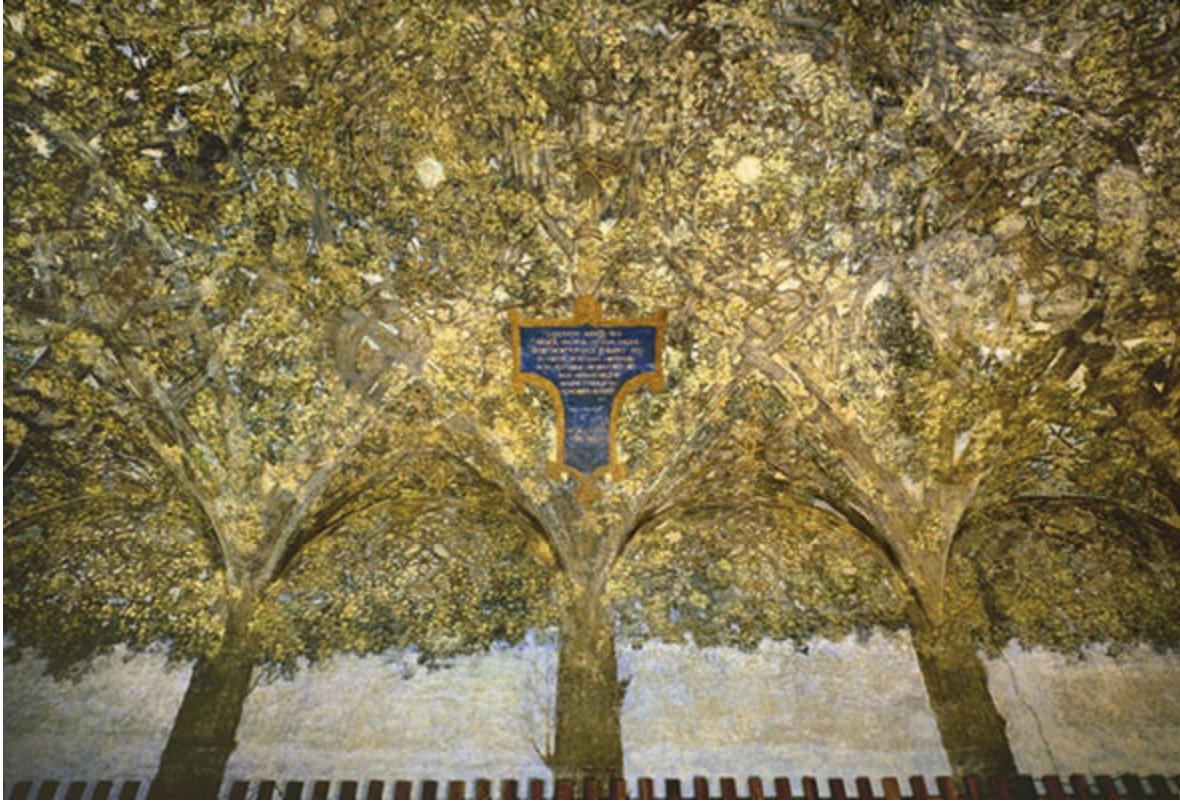
Leonardo da Vinci u.a., Maulbeerbäume, um 1496/98, Tempera auf Putz, Mailand, Castello Sforzesco, Sala delle asse.