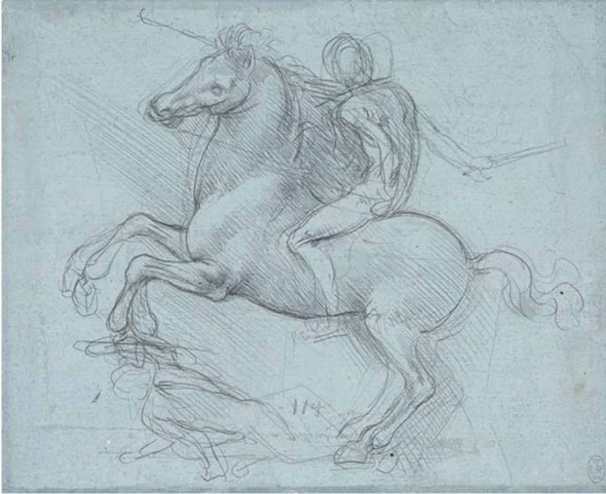
Leonardo da Vinci, Studie für ein Reiterdenkmal, um 1485/90, Metallstift auf blauem Papier, 15,2 × 18,8 cm, Windsor Castle, Royal Library.