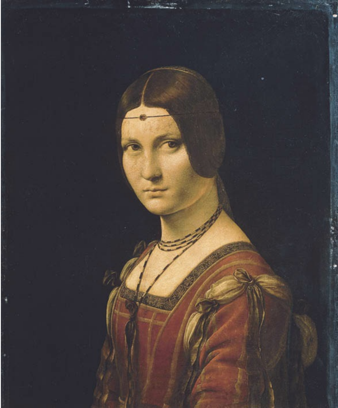
Leonardo da Vinci, Porträt einer Unbekannten («La Belle Ferronnière»; Lucrezia Crivelli?), um 1495 (?), Öl auf Nußbaumholz, 63 × 45 cm, Paris, Musée du Louvre.