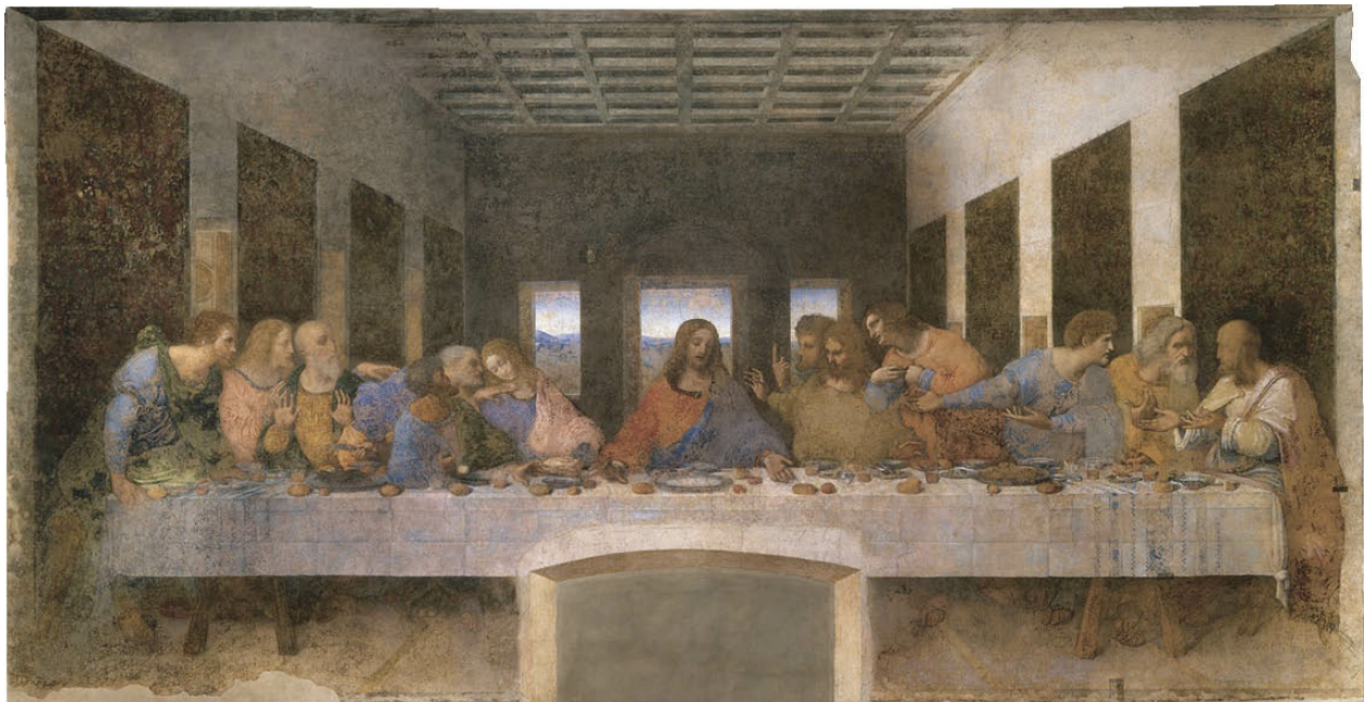
Leonardo da Vinci, Das letzte Abendmahl, um 1495–1497, Tempera und Öl (?) auf Putz, 460 × 880 cm, Mailand, Santa Maria delle Grazie.