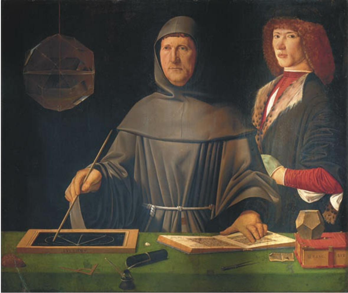
Jacopo de' Barbari (?), Luca Pacioli, 1495, Öl und Tempera (?) auf Holz, 98 × 108 cm, Neapel, Museo di Capodimonte.