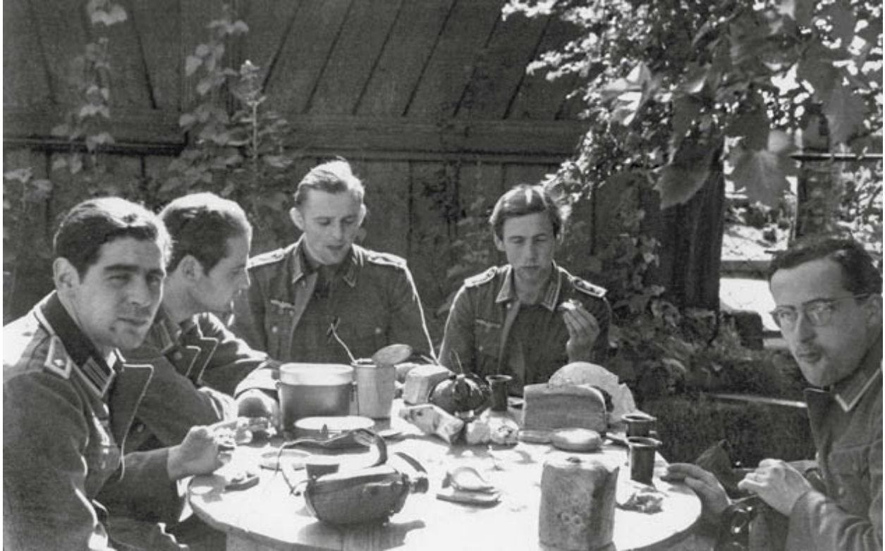
Hans Scholl, Willi Graf und Alexander Schmorell (zweiter, dritter und vierter von links)