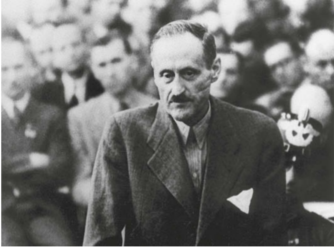
Ulrich von Hassell vor dem Volksgerichtshof