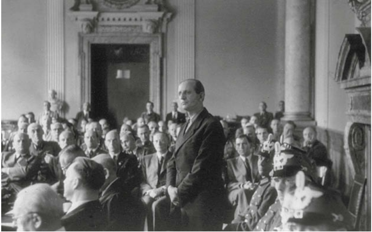
Fritz-Dietlof von der Schulenburg vor dem Volksgerichtshof