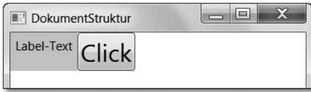
Abbildung 2.1 Fenster mit Panel und zwei Unter-elementen

Im nachfolgenden Projekt DokumentStruktur werden alle Begriffe dieses Abschnitts an einem kleinen Beispiel erläutert (siehe Abbildung 2.1).