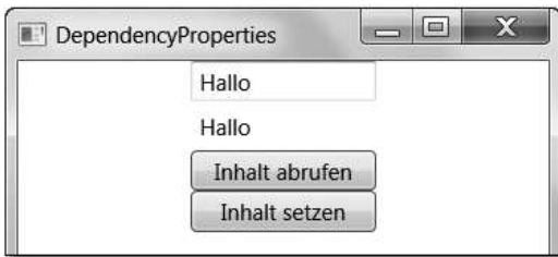
Abbildung 2.3 TextBox, Label und zwei Buttons

Im nachfolgenden Projekt DependencyProperties wird ein Beispiel dargestellt, wie Dependency Properties zur Datenbindung genutzt werden können (siehe Abbildung 2.3). Mehr zum Thema Datenbindung folgt in Kapitel 8, »Daten«.