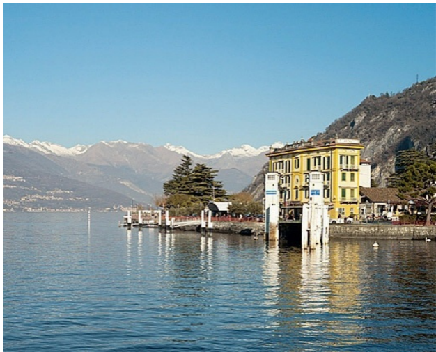
Bellagio liegt zauberhaft am Ufer des Comer Sees