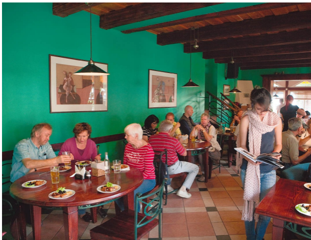
Zünftige Stärkung auf der Kurischen Nehrung