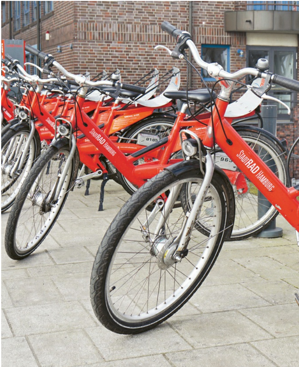
Im Internet anmelden, losfahren

vom Hamburger Rathaus über 100 km, die Ostsee 84 km entfernt.