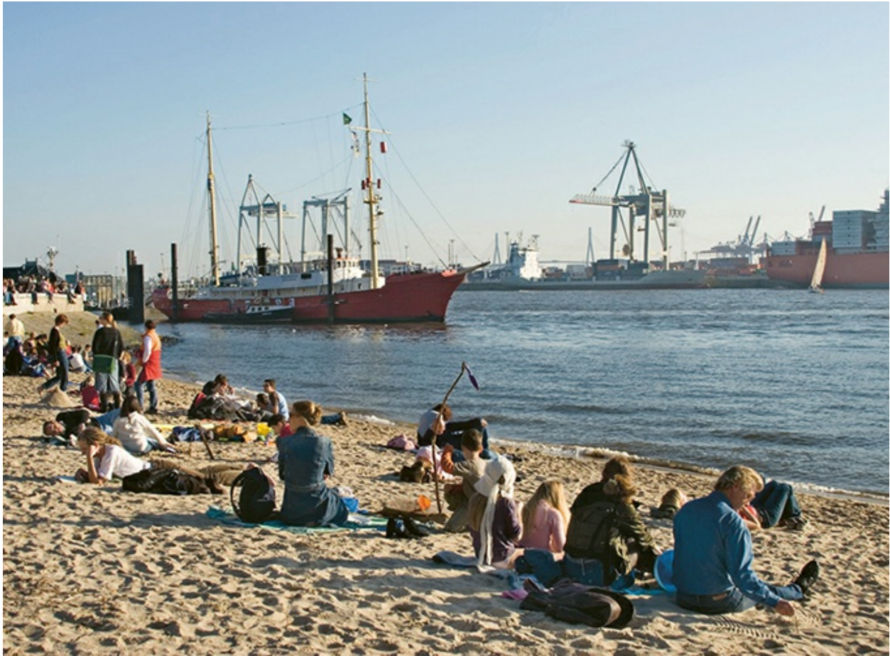
Am Elbstrand faulenzten und von der weiten Welt träumen

24 Orgelmusik im Michel Stille Einkehr täglich mittags um 12 Uhr in der Hauptkirche Hamburgs, St. Michaelis >. Im Anschluss an eine kurze ökumenische Andacht erklingen oftmals die mächtigen Orgeln.