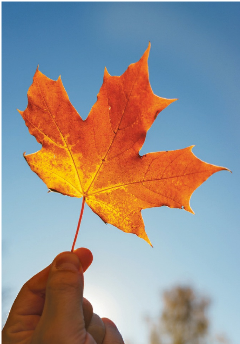
Maple leaf - ein ebenso einfaches wie schönes Souvenir aus Ostkanada

33 Ins Netz gegangen Kunstvoll angefertigte Traumfänger, sogenannte dream catcher , halfen einst in den Wigwams der First Nations, böse Träume zu fangen und sind heute wunderbare Mitbringsel, wie jene aus dem Whetung Ojibwa Centre (ab 10 $) >.