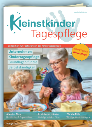
Unternehmen Tagespflege Best.-Nr.: P01 0645