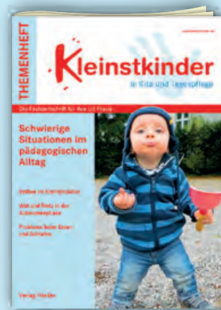
Schwierige Situationen im pädagogischen Alltag Best.-Nr.: P01 0652