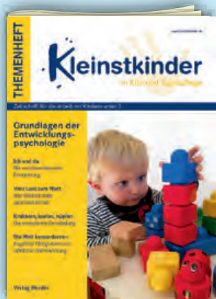
Grundlagen der Entwicklungspsychologie Best.-Nr.: P01 0629