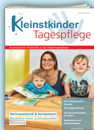
Vertrauensvoll & kompetent Best.-Nr.: 401 0468