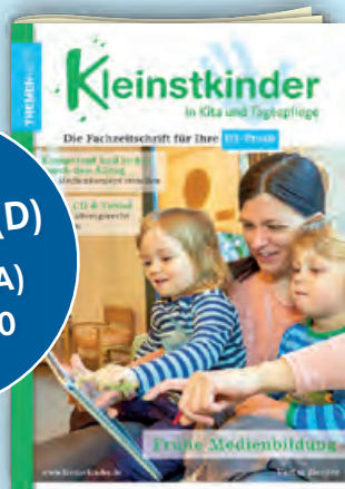
Frühe Medienbildung Best.-Nr.: P01 0678