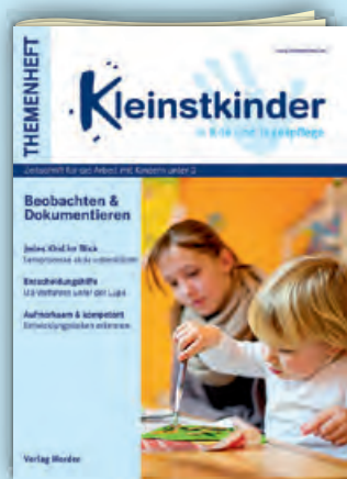
Beobachten und Dokumentieren Best.-Nr.: P01 0637