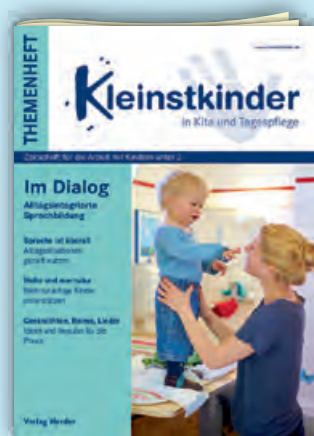
Im Dialog Best.-Nr.: P01 0488