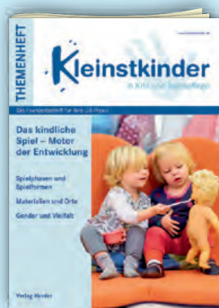
Das kindliche Spiel Best.-Nr.: P01 0660