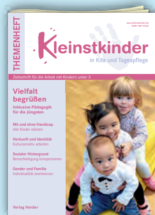
Vielfalt begrüßen Best.-Nr.: P01 0470