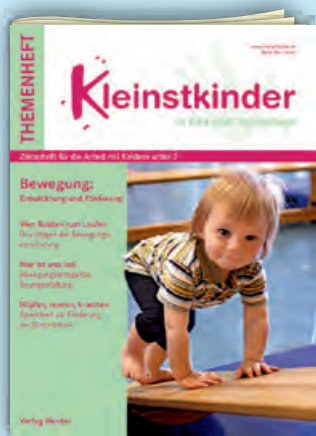
Bewegung Best.-Nr.: 401 0252