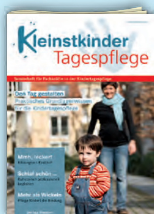
Den Tag gestalten Best.-Nr.: 401 0450